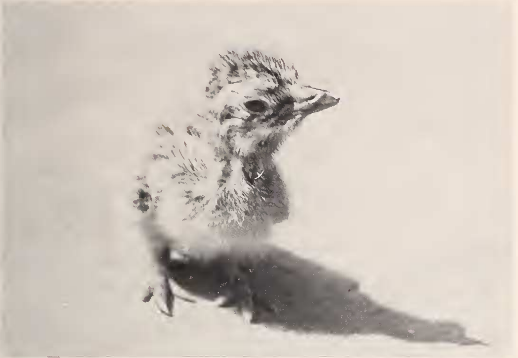
Abb. 11: Wenige Stunden altes Küken.